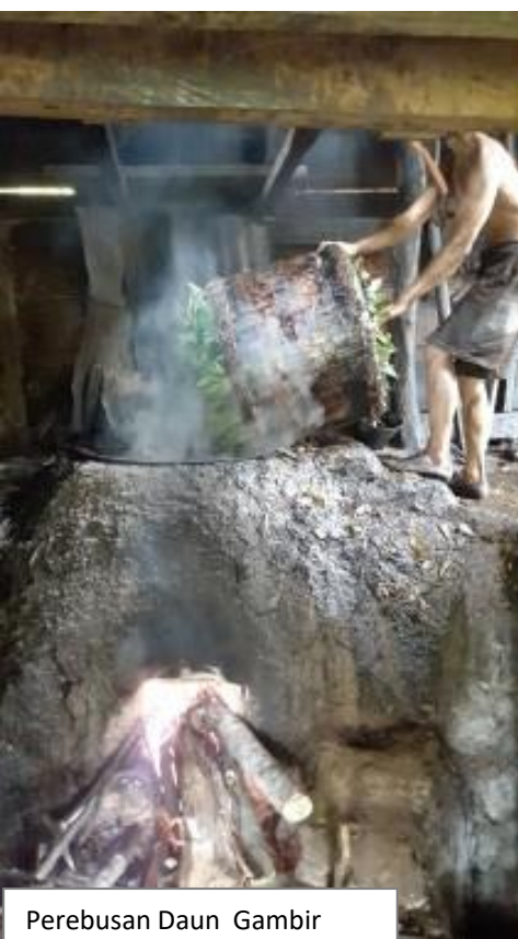
Perebusan Daun Gambir